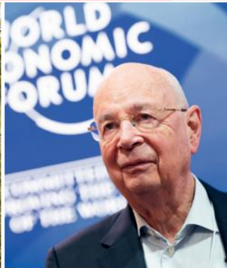
LAURÉAT PRIX SPÉCIAL DU JURY FORUM ÉCONOMIQUE MONDIAL (WEF) Prof. Klaus Schwab, fondateur